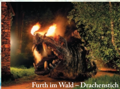
Furth im Wald – Drachenstich

Nyní jsou kopce na obou stranách cyklotrasy vyšší a vy získáváte imponantní dojem – takřkajíc ze sedla, podobný jako ve starověku – nacházíte se uprostřed největšího lesnatého pohoří v Evropě.